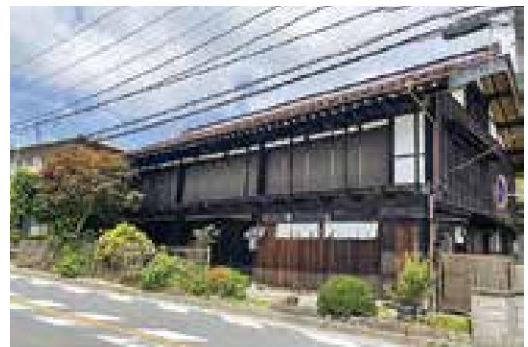
古民家(宿場時代の旅籠の一つ)