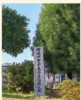
淵辺義博伝承の碑