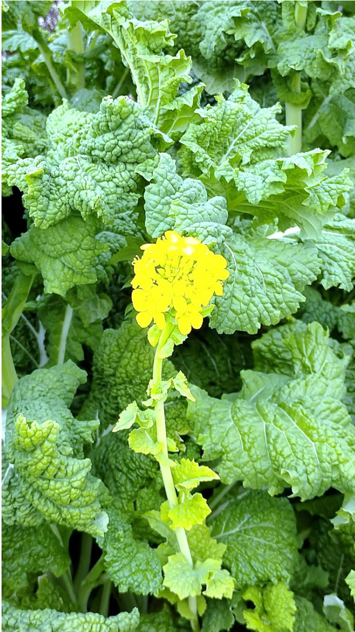
菜の花（猫バス停留所前）