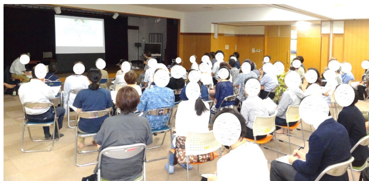
渡邊氏による講義の様子