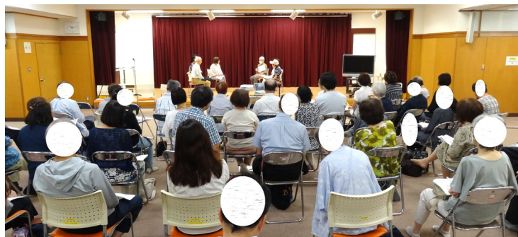
デモンストレーションの様子