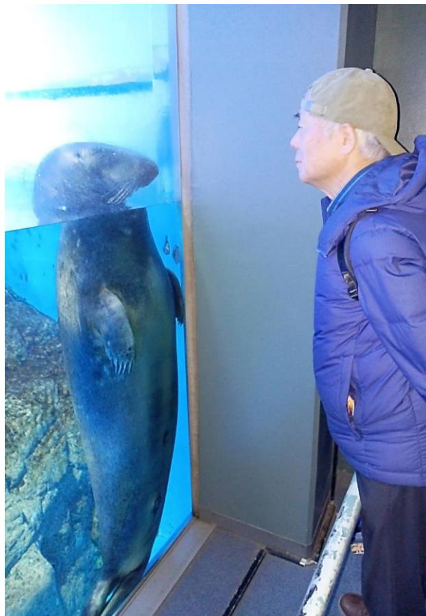
3月9日八景島シーパラダイスにて

ではあなたは、私の心が存在することを認めてくれるだろうか。もし認めていただければ、私の存在はより安定したものになるように思われる。